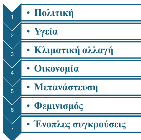
Σχήμα 2. Θέματα στα οποία εντοπίζονται ψευδείς ή παραπλανητικές πληροφορίες